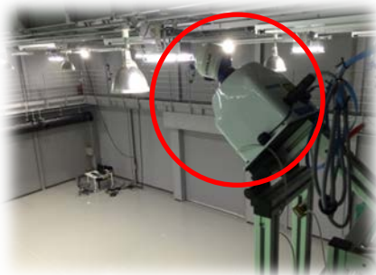
アリーナ内の4か所に設置し、アリーナ全体をスキャン