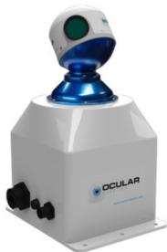
OCULAR Robotics, RE05 3D LIDAR Scanner